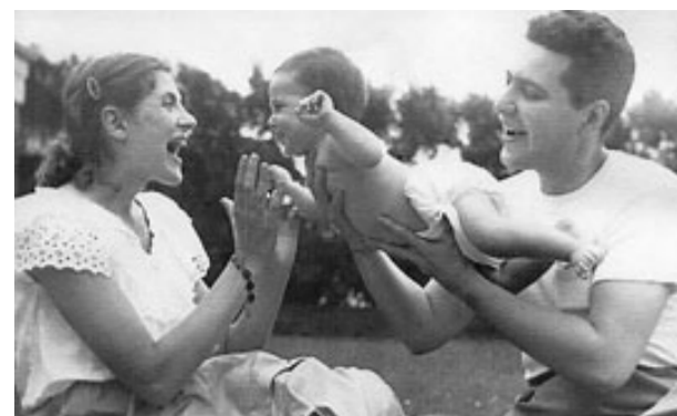
Una imatge del curtmetratge documental Four questions for a rabbi , finalista del Curt.doc09.

La sala Art i Joia també serà, del 26 al 28 de juny, la seu de la segona edició del Cicle de Cinema Llatinoamericà de Cadaqués, organitzat per les associacions Icones, Ariac, i la Càtedra Unesco de Desenvolupament Humà Sostenible, de la UdG.